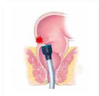
Beim Einführen des Staplers kollidiert die eckige Kante mit den Schleimhautfalten (Mucosa): Gefahr der Perforation